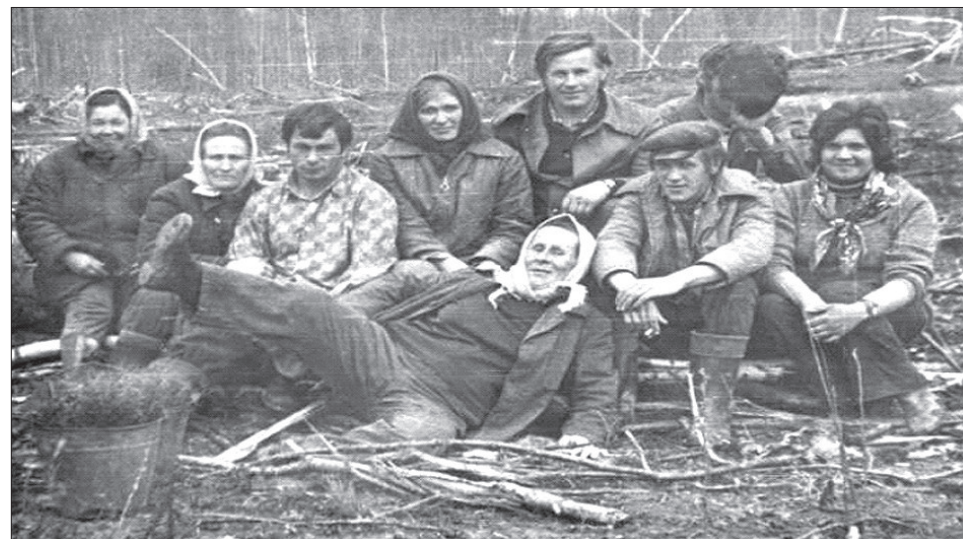
На посадке леса и сборе сучьев